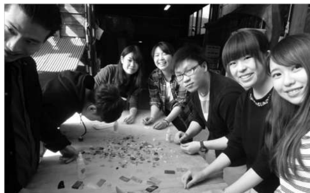
日本食文化の脳役「はしおき」を作成体験する参加者(glass Art Blue moonにて)