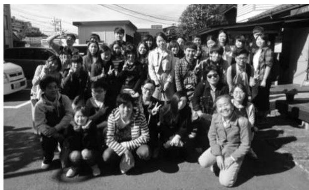
秋の陽気に恵まれた交流会。埼玉県川越の集合写真(松本醤油工場にて)

二松学舎大学では、学生同士の国際交流および日本の自然・文化・歴史に触れることを目的に、留学生参加の小旅行を行っています。