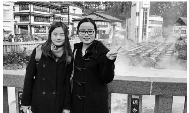
草津にて友人と一緒に（筆者右）

人生はいろいろな人と事との絆からなっているのだと思いますので、留学生活はその中で重要な部分を占めています。