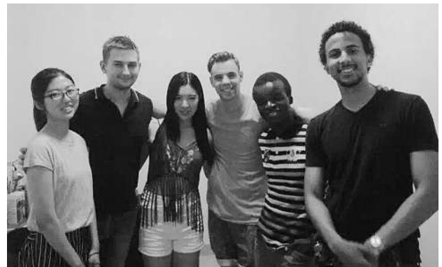
クラスメイトと（筆者左から3番目）

留学した一年間はあっという間に過ぎてしまいました。時間が経つのを速く感じるのは留学生活が楽しいからだと思います。この一年間で私は中国語だけでなく英語も以前より上手くなり、さらに友たちから少しだけロシア語も学びました。HSKのスコアも留学する前に比べ10点近く伸び本科の授業で中国の歴史や文化についての知識を広めることが出来ました。しかし私にとって一番大事なことはこれらではありません。私にとって一番大事な事、それは中国人と同じような生活をする事で中国という国をより深く知ることができました。この一年間は私にとってとても貴重な体験になり、この機会を下さった先生方に感謝します。