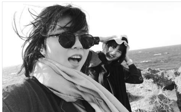
沖縄の万座毛にて(筆者左)

この一年間は多くの人のおかげで本当に楽しい留学生活になりました。もうそろそろ帰国ですが、帰国しても、二松学舎大学の皆さんと必ずどこかで会えると信じています。日本、またね。二松学舎大学の皆さん、またね。