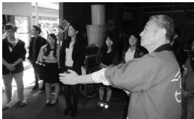
伝統的な醤油つくりの工程を熱心に聞く参加者

いろいろな国籍の留学生と日本人学生が、一日かけて国際交流を行いました。国際交流サポーターによる楽しいバス内アクティビティもあり、終始なごやかな雰囲気の中、無事に終了しました。当日は天気にも恵まれ、秋の旅情を満喫しました。また参加したいという声がたくさん聞かれました。