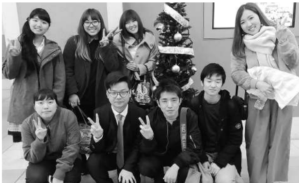
二松学舎大学中国語文研の友達とともに（筆者前列左から2番目）

だから最後、みんなのおかげで私は準優勝を取った、父母会賞を授賞した。ここでもし一つ言葉を言うなら。それはこの父母奨は私自分の努力だけではなく、みんなと一緒に頑