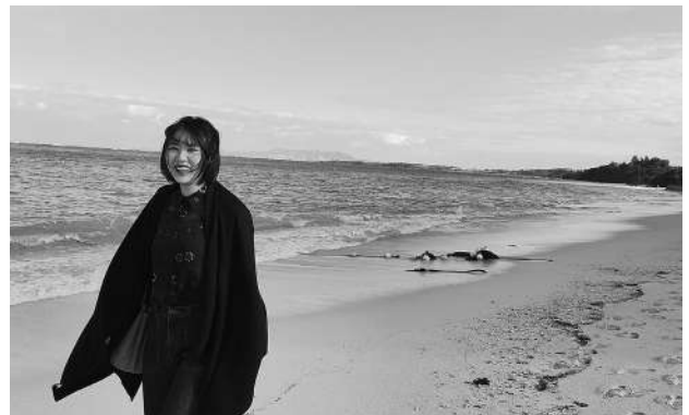
美しい海岸の沖縄を観光

えば、中国の正月はどう過ごしますかって聞かれても、家族が集まって、一緒に食事をするしか答えられませんでした。前は全然そういうことを考えたことなく、中国にいる時、文化的なものは当たり前だと受け入れすぎて、考えようとしませんでした。私がそう気づいたのは日本に来てからです。日本に来て、日本の文化に触れることは非常に楽しいことです。今は改めて自分の国の文化をしっかり身に付けるのはどれくらい大切なのか、身にしみました。これから日本にいる時間を無駄にしないよう、勉強していきたいと思います。