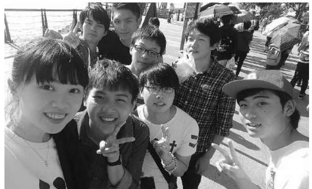
台湾の友人達と淡水観光（筆者右）

最後に、今回留学するに当たり、私の志しを理解し金銭的にも精神的にも支えてくれた両親には一番感謝したいと思います。また、留学に関わって下さった教職員の方々、台湾で出会った全ての人、そして台湾には感謝したいです。本当にありがとうございました。